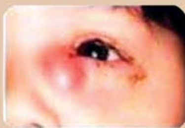
รูปแสดงการติดเชื้อจากท่อน้ำตาอุดตัน