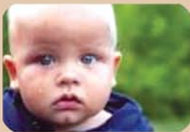
รูปแสดงอาการทางเดินน้ำตาอุดตัน