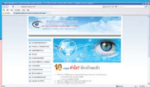
Website ศูนย์จักษุและต้อกระจก โรงพยาบาลบ้านแพ้ว (องค์การมหาชน)

โรงพยาบาลบ้านแพ้ว (องค์การมหาชน) 198 หมู่ 1 ต.บ้านแพ้ว อ.บ้านแพ้ว จ.สมุทรสาคร 74120 โทรศัพท์ 034-419555 ต่อ แผนกจักษุ Email : banphaeo-eye@hotmail.com